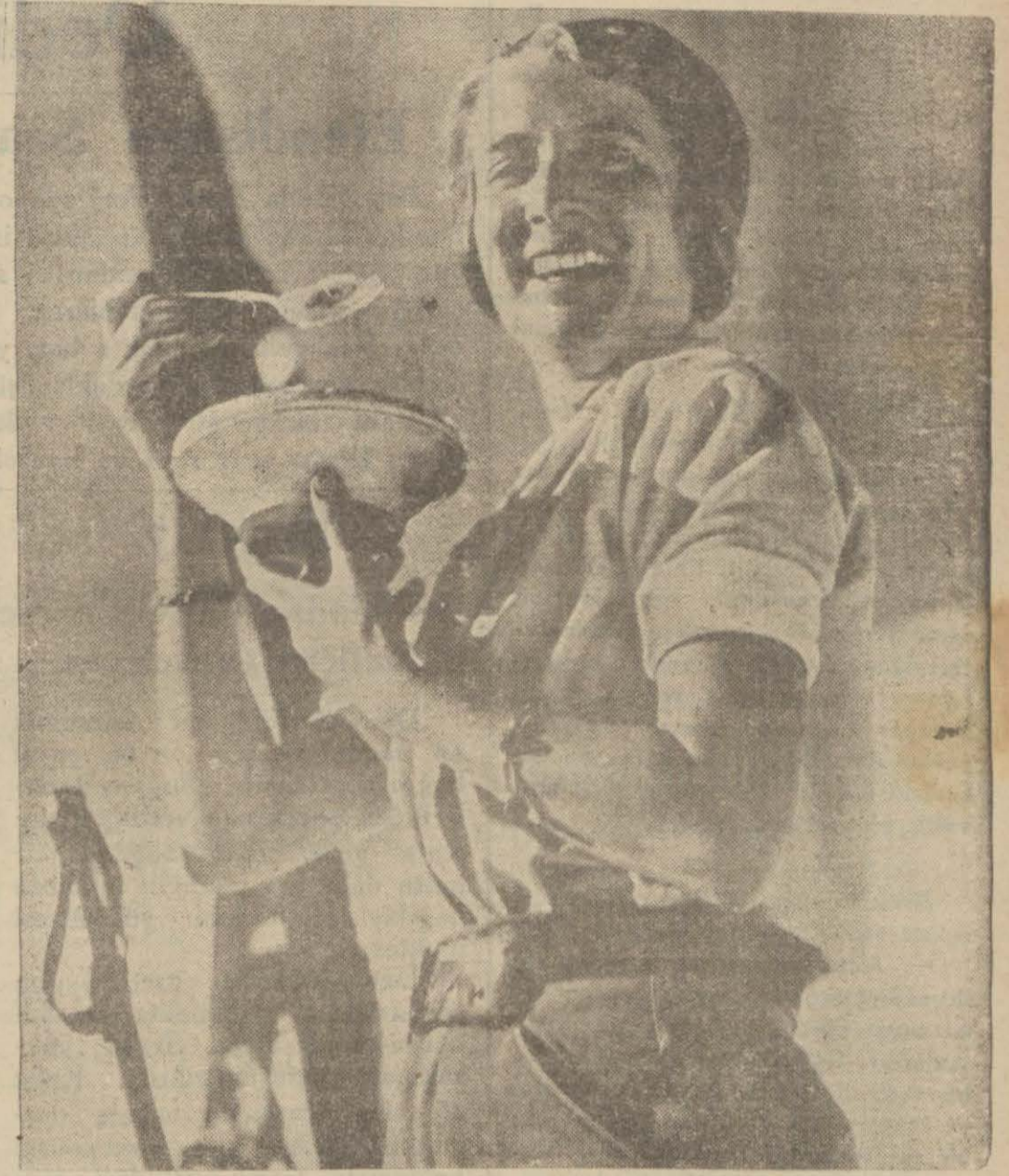
Biz seyyah kıtlığından sık sık şikâyet edip dururuz. Bakınız başka memleketlerde seyyah celbi için nasıl propaganda yapıyorlar! Şu kız Almanyada bir spor bayramında 50 bin genç kız arasında birinci olmuştur. Şimdi bütün Avrupa şehirlerini dolaşarak Almanyaya seyyah akını temin etmek için propaganda yapacaktır.