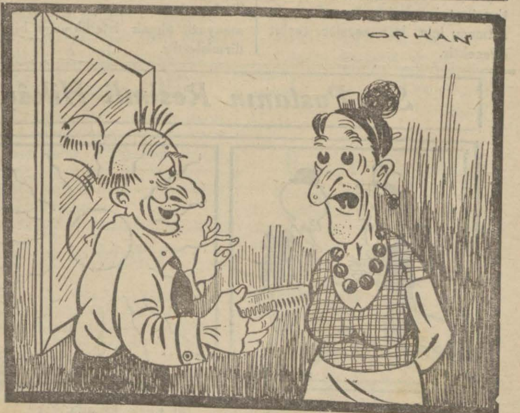
— Karıcığım, saçlarımı yana mı, yoksa arkaya mı tarayayım. Bana hangisi yakışıyor?